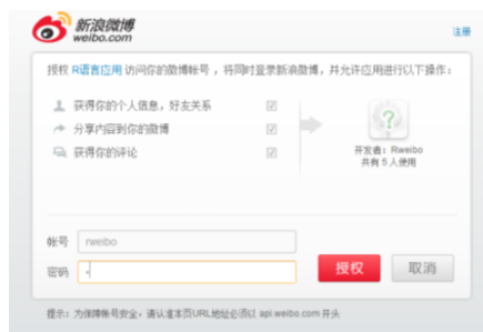
图 1: 应用授权页

OAuth授权的过程中，执行完 createOAuth信息后，将会自动弹出一个授权页，如果需要重新登录，第一个页面是应用授权的登录页，见图1。